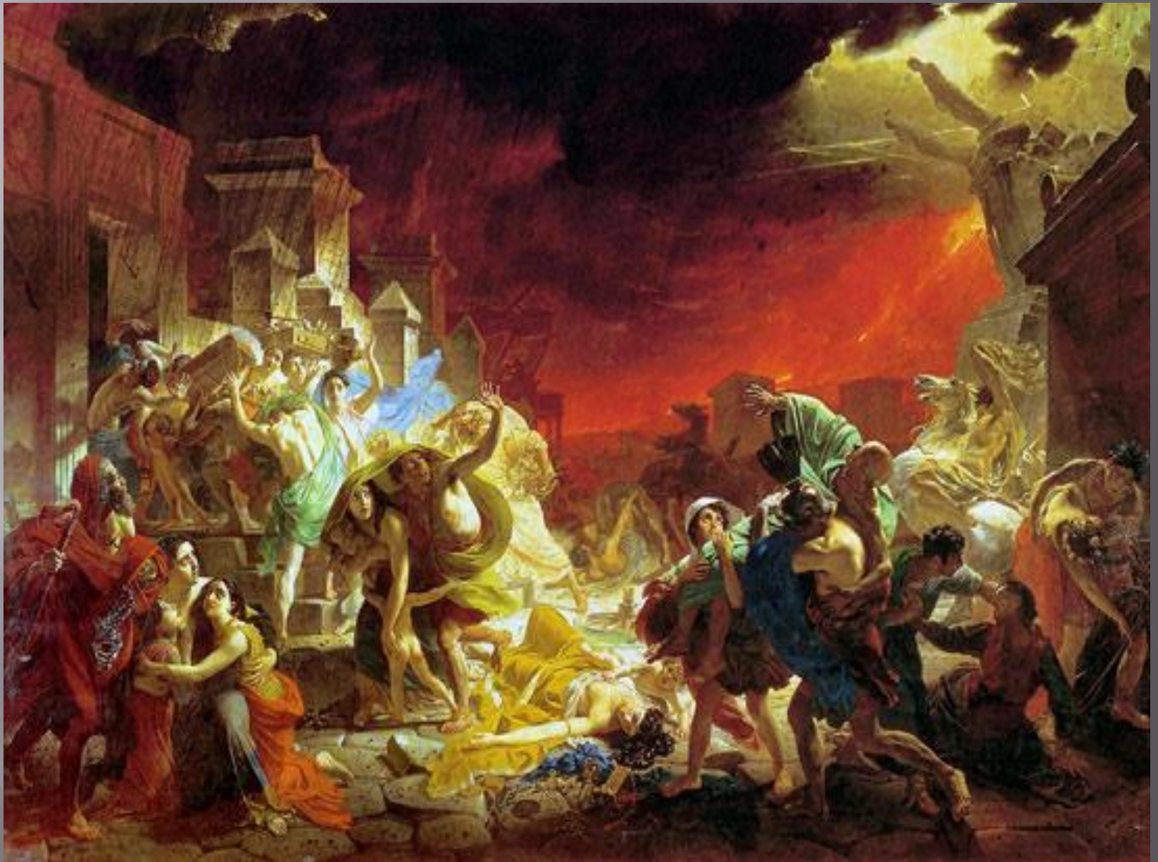
«Последний день Помпеи»