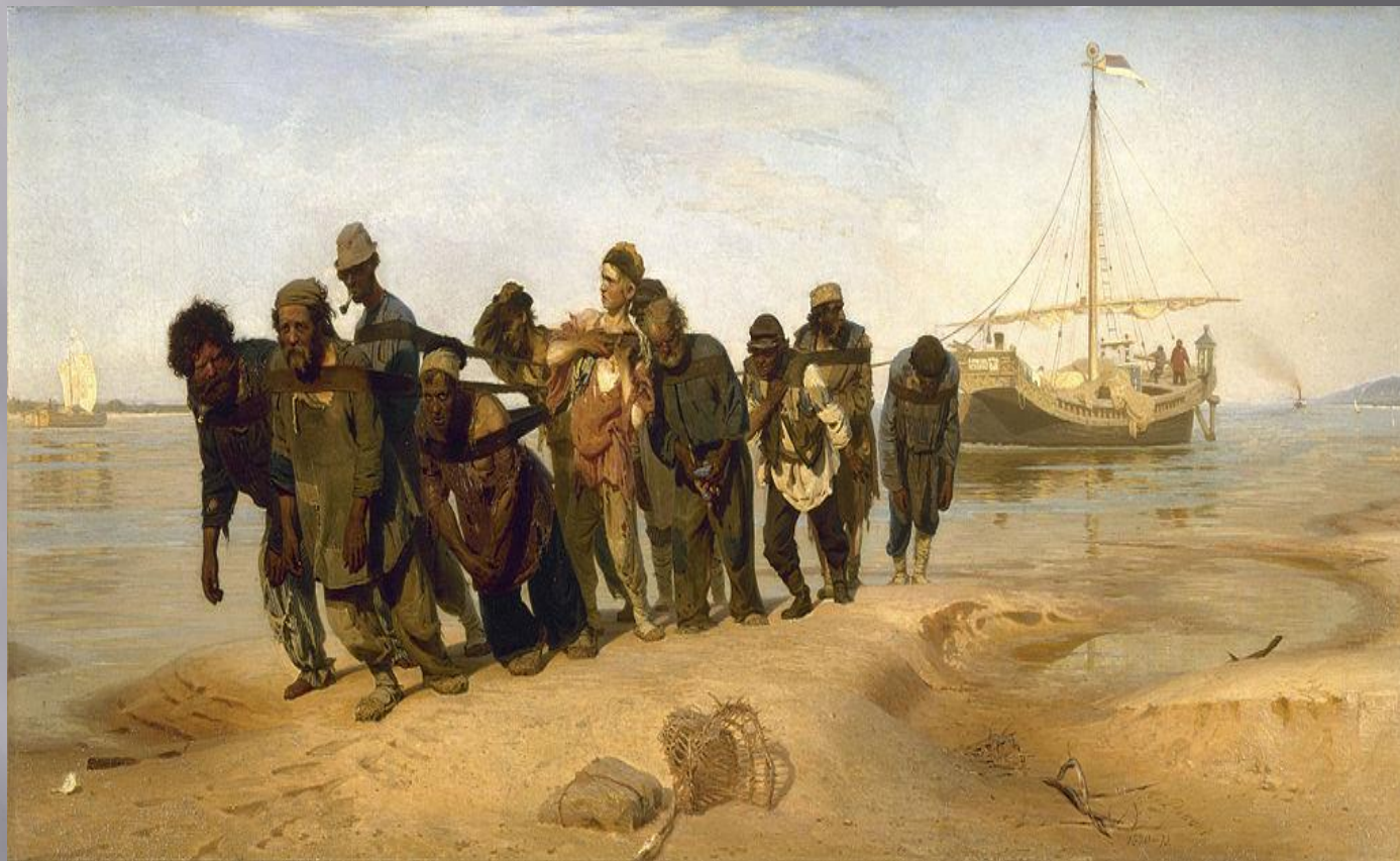
«Бурлаки на Волге»