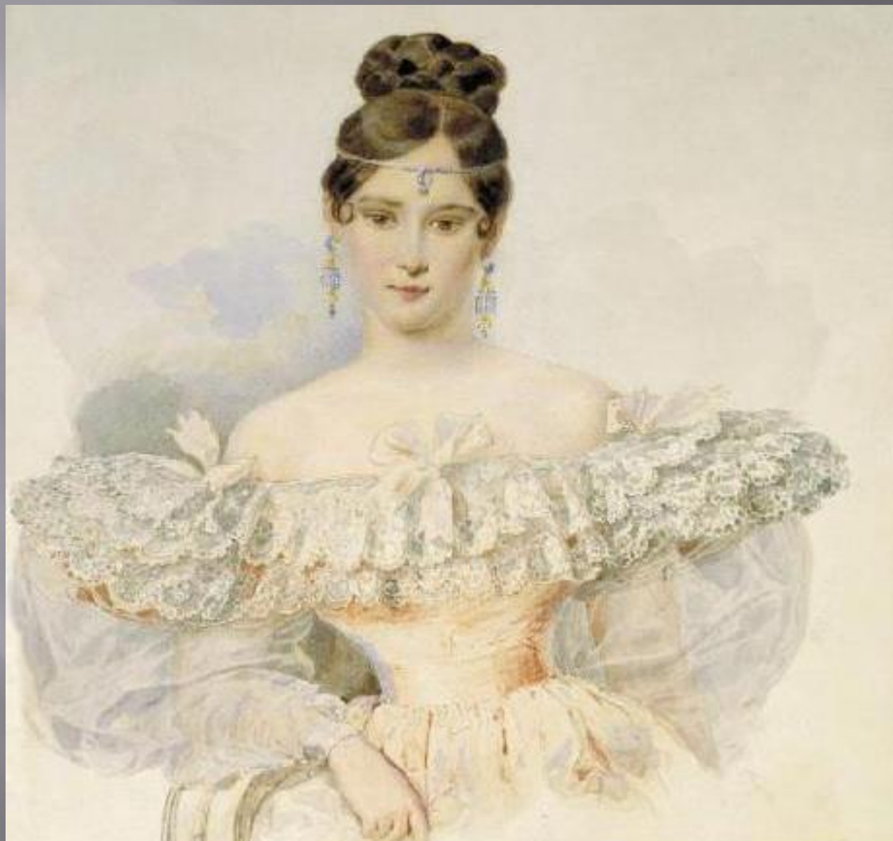
Портрет Н.Н. Гончаровой